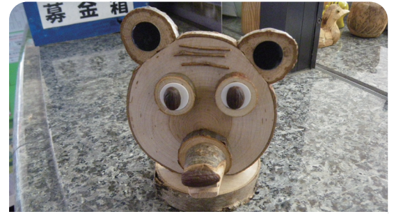
木工クラフト作品例