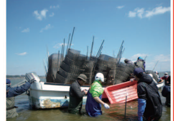
4/24 人工産卵床設置作業

外来魚駆除は、震災後の対応で大変忙しい中、今年度もボランティアの方々に手伝っていただき作業を進めることができました。