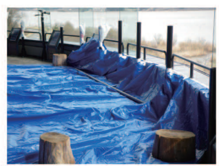
応急処置後のセンター