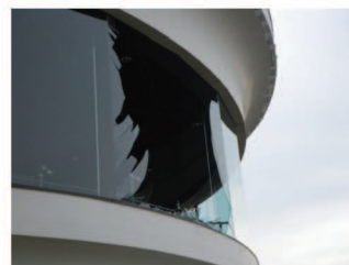
本震と余震の被害状況