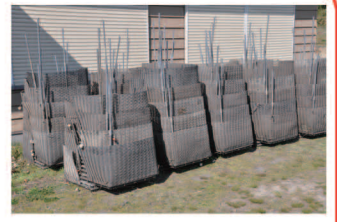
4/17 人工産卵床の組み立て作業