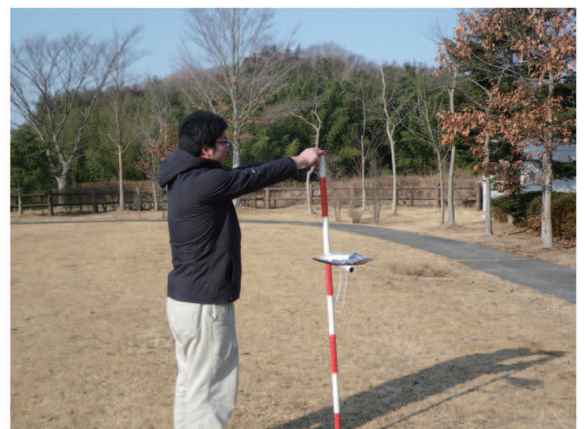
放射能測定の様子

なお、当財団のホームページでは、センター敷地内での放射能測定結果を掲載しております。