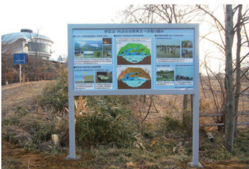
※この看板は、環境省 東北地方環境事務所、宮城県により設置されました

写真やイラスト中心に描かれており、とてもわかりやすく説明されています。ご来館の際は、ご覧ください。