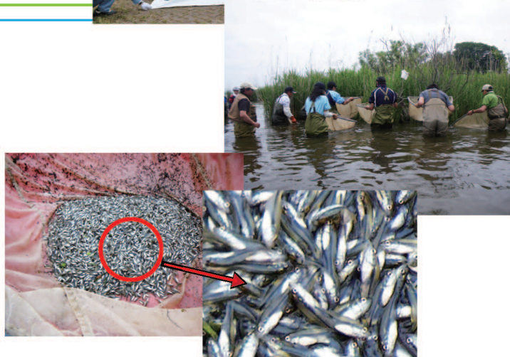
稚魚すくいの様子（上）とブラックバスの稚魚（下）