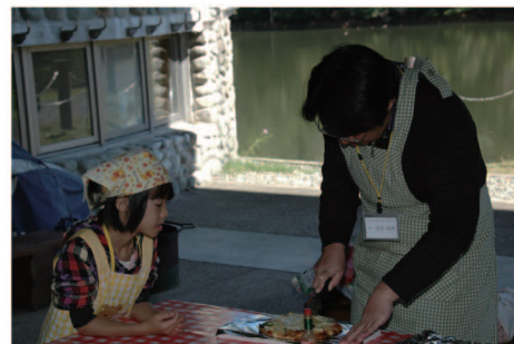
山形県鮭川村ピザ焼き体験