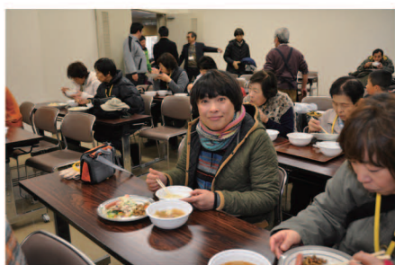
おいしいおいしい朝ごはん♪

11月18日(日)、第8回伊豆沼・内沼自然体験講座を開催しました。東京都や山梨県、地元栗原市から26名の方々が参加しました。マガンの飛立ちを観察し、地元の食材を使った朝食を食べた後バスで蕪栗沼と化女沼を巡りました。