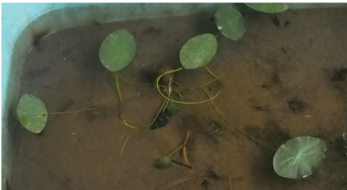
20年ぶりに見つかったジュンサイの株

伊豆沼・内沼で採取された泥から、ジュンサイが発芽しました。ジュンサイは20年前の調査を最後に姿を消した水生植物です。新芽につく寒天質のぬるりとした食感が好まれ、1960年代までは、「伊豆沼じゅんさい」として出荷されていました。