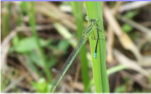
オオセスジイトトンボ Paracercion hieroglyphicum