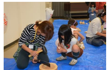
完成めざして頑張ってます！

10月10日(土)、第5回 伊豆沼・内沼自然体験講座「木工クラフト教室」を開催しました。合計14名の小学生が参加し、講師のご指導のもと普段見たことのないような道具を使い、木の切れ端や枝を何度も組み立てなおし、鳥や昆虫などを作りました。最後に、夢中になって作った作品を片手にみんなで記念写真を撮りました。