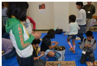
材料選びも真剣に！