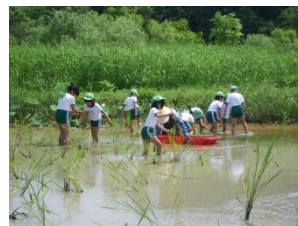
マコモの植栽活動

日時：平成27年11月28日(土) 9:00~16:30 場所：宮城県伊豆沼・内沼サングチュアリセンター