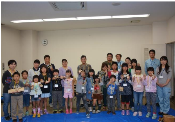
作った作品を持ってハイ、チーズ！！