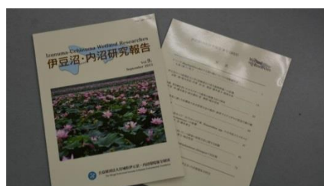
伊豆沼・内沼研究報告 9号

伊豆沼・内沼を中心とした平野部の湿地に関する論文を取りまとめた伊豆沼・内沼研究報告9号を発行しました。宮城県に侵入した外来の淡水エビの報告など、面白い研究がもり沢山です。なお、この研究報告の内容については、館内の図書コーナー及びホームページでご覧頂けます。