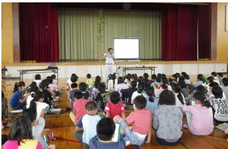
体育館で湿地の説明を聞く子どもたち