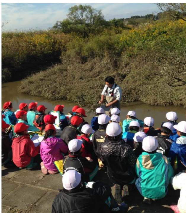
蕪栗沼で湿地にくらす生きもの の説明を聞く子どもたち